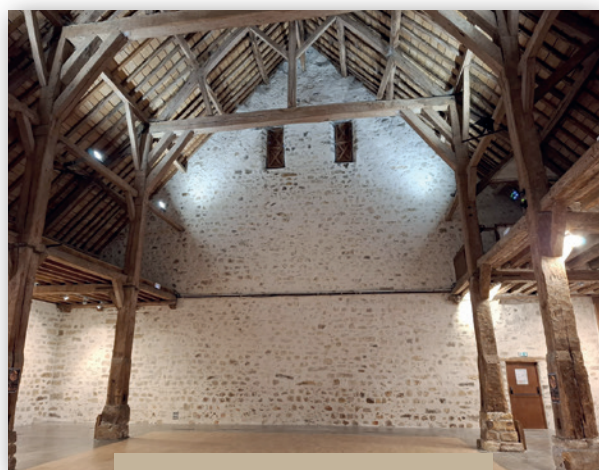
L'intérieur de la Grange aux Dîmes