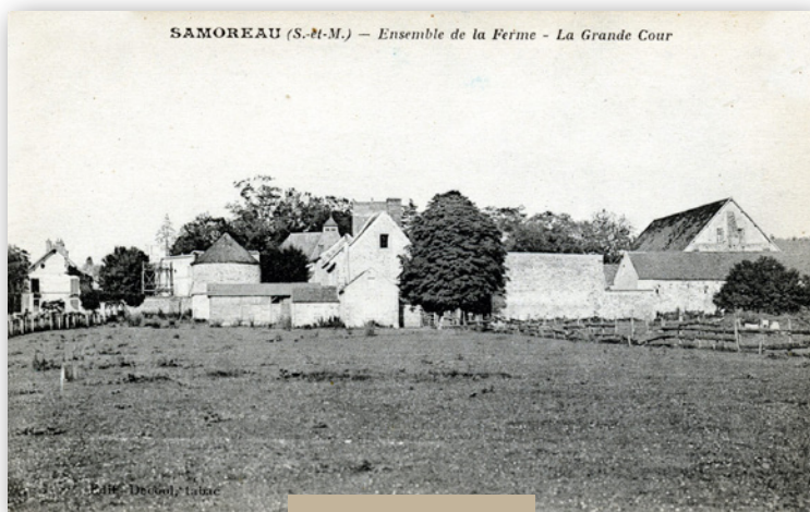
Début du 19 e siècle