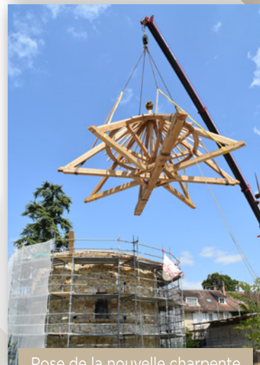
Pose de la nouvelle charpente août 2025