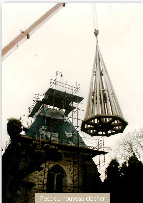
Pose du nouveau clocher 1987

Construits ultérieurement le chœur et le transept droit, couverts d'ardoises, sont de style gothique tardif comme l'attestent les arcs tiercerons (nervures auxiliaires).