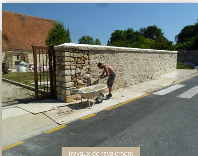
Travaux de ravalement 2025

Ce projet ambitieux est porté par la Mairie de Samoreau, déterminée à préserver et valoriser ce patrimoine exceptionnel pour les générations futures.