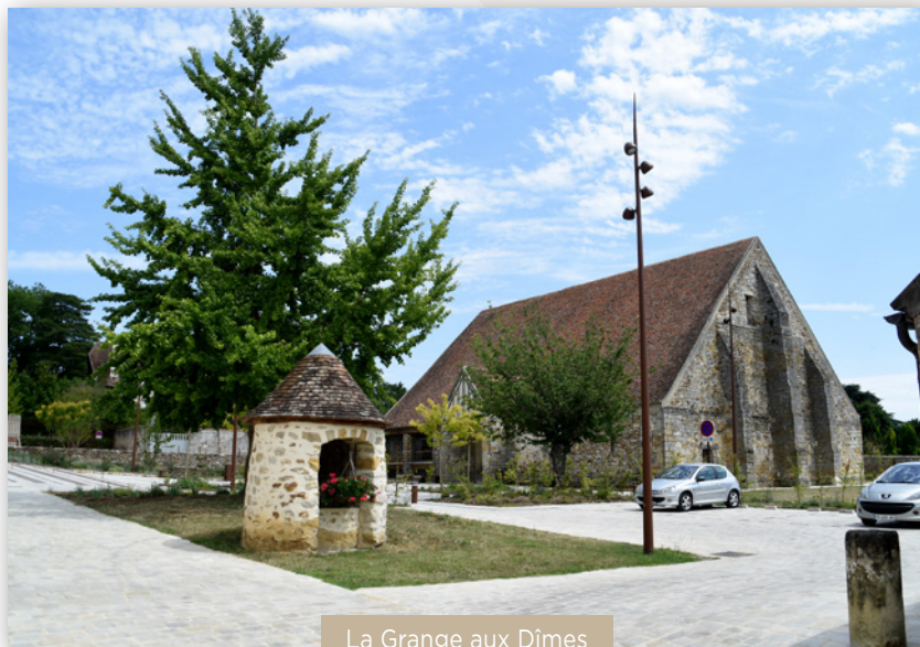
La Grange aux Dîmes 2025

La restauration de ce site est cruciale pour conserver son rôle en tant que témoin vivant de notre héritage culturel et pour lui attribuer de nouvelles fonctions.